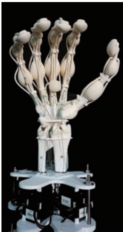
図1 研究者たちは、独自のレーザーキャニング技術を利用して、さまざまな硬質および弾性ポリマーから、骨、靭帯、腱を備えたロボットハンドを、すべて単一のより効率的なプロセスで3Dプリントした

共同研究チームは、Vision Controlled Jetting (VCJ) と呼ばれる