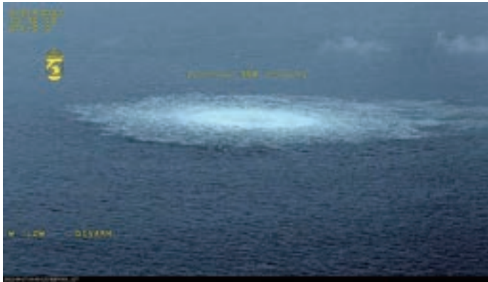
図3 NTNU研究者によると、光ケーブルネットワークは、バルト海のノルドストリームにおける2022年のガス漏れのような漏出の監視に適している

は、SNRの品質と延長距離に関する開発にも取り組んでいる。究極的に研究者は、同技術を120kmから1000kmの範囲に強化する計画である。