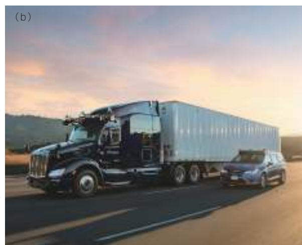
図2 (a)「オーロラ・ファーストライト・ライダ (Aurora Firstlight Lidar)」は、「オーロラ・パシフィック (Aurora Pacific)」自動運転車の前面に取り付けられている。(b)オーロラ社は、パシフィックカーと自動運転トラックの自動運転システムで同様のライダを使用している。ライダはフロントガラスの上のセンサーの中央にあり、他のセンサーは左右にある。

を開始した米ベロダイン・ライダ社 (Velodyne Lidar)や他のいくつかの企業と ToFライダで多くの競争を繰り広げている。