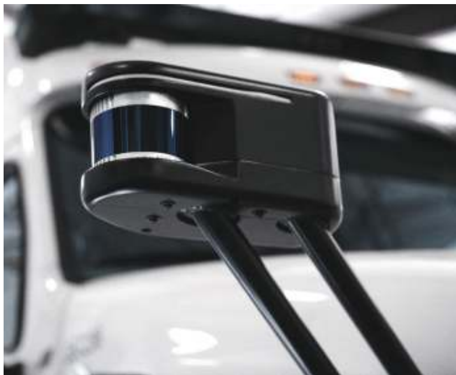
図1 トゥーシンプル社の自動運転トラックで使用される200m範囲のライダ。これはトラクターユニットのボンネットの片側のヘッドライトの上部、少し後方に取り付けられている。2つ目のライダは他方の上部にある。

サプライチェーンの構築と生産の自動化には、人的リソースと資金的リソースが必要である。ルミナー社は、社内で製品を構築することから始め、その後、委託製造業者などとのパートナーシップを発展させた。同社は、チップレベルから構築し、ダイの配置、ワイヤボンディング、及びその他のステップを実行することから始めた。製品