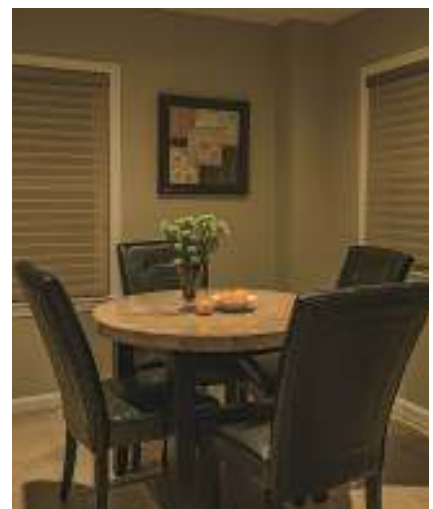
図3 朝食エリアの照明は、Diningモードに設定して朝食に適した比較的清涼な印象の光とすることができる(左)。夜はNatural設定にすると、非常に暖かい雰囲気になる(右)。