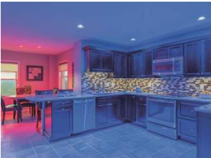
図7 Entertainモードは、照明をパーティー用にするために使用できる。

照明業界が、エネルギー重視の段階から、LED光源から得られる他の価値やメリットを追求する「LEDification」（LED化）とも呼ばれる次なる段階へと移行するにつれて、HCLが、注目を集める概念の1つになることを期待する。ケトラ社などの企業は、このミッションに全力を注いでおり、自然な光とともにエネルギー効率も達成できることを実証している。