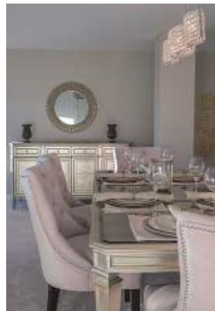
図5 ケトラ社のHCLプラットフォームは、このシャンデリアのような照明器具用の既存ランプをサポートする(左)。Relaxモードで従来の位相調光制御を適用すると、明るさが落とされて暖かい雰囲気になる(右)。

本稿で取材したプロジェクトでは、パート1でも触れたように居住者が光に過度に敏感な人だった。そのような場合は、ケトラ社の社員や業者の担当者が、システムのプログラム設定や、スマートプラットフォームが生成するキュレーションされたコンテンツ(これについてはパート1を参照のこと)を変更することができる。本稿の住宅リノベーションの場合は、光レベルが一般的に、ケトラ社の基本設定よりも引き下げられた。