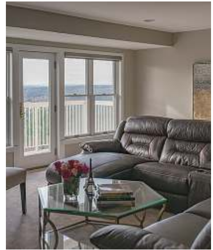
図2 正午ごろのリビングエリアにおいて、Relax設定の光度は比較的低い(左)。Natural設定に切り替えると、リビングエリアの光度が引き上げられて、正午の自然な光により近づく(中央)。Away設定は、空間に誰もいない場合に消灯するために使用される(右)。

being.com/usa/)。すでに、そのプログラムは明らかになっているが、以下では、本誌が実際に現場取材して洞察を得た、住宅リノベーションプロジェクトを見ていきたいと思う。