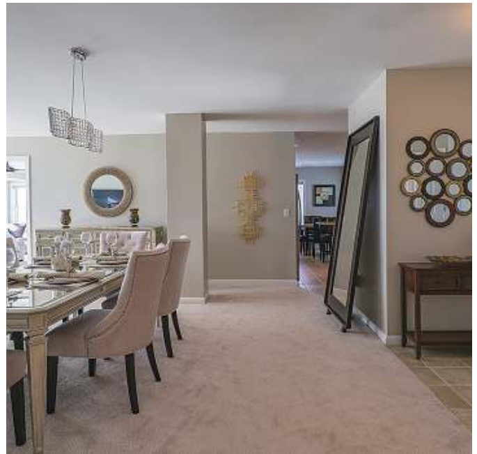
図4 夜のメインダイニングエリアにおいて、Natural設定は暖かい雰囲気を出し出す(左)。同じNatural設定でも、朝はかなり冷たい印象になる(右)。

のRelaxは中央のNaturalよりも光度が低い。一番右の写真は、Away設定で照明が消灯された状態にある。