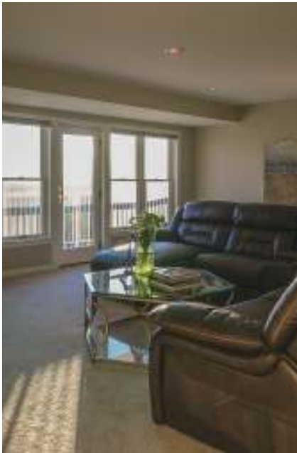
図6 ケトラ社のシステムは、自然な白色の光に加えて飽和色を提供できる。

ョン製品にまだ対応していないことも不便に感じた。はるかに安価な調光可能照明製品でもそのようなデバイスに対応する。ただし、以下で触れるが、それらで同等の照明機能は得られない。