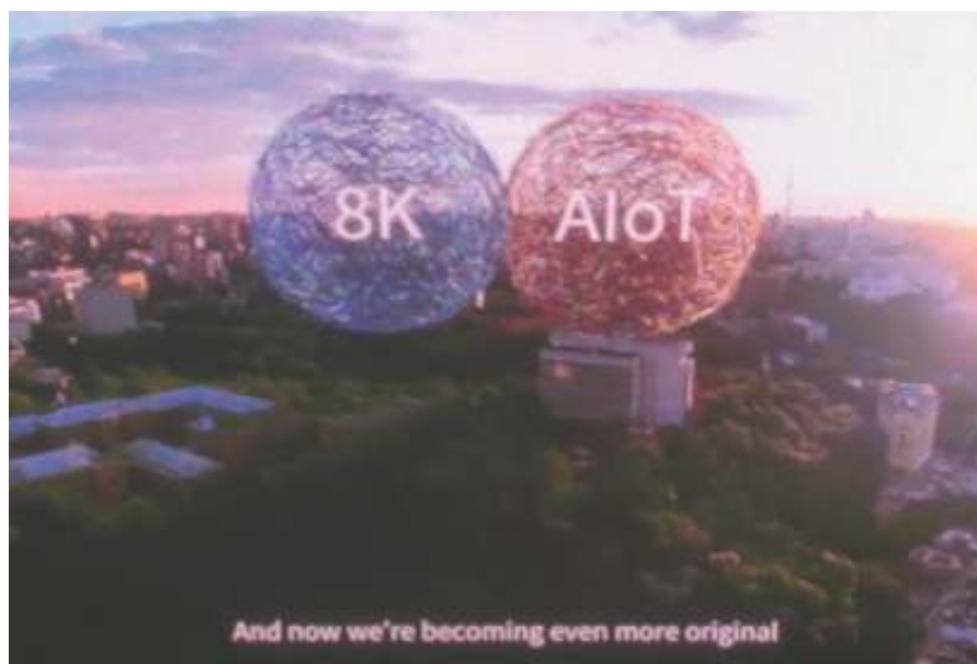
図3 新製品の520nm、130lmを搭載したプロジェクターのデモ画像。シャープの強みは、RGBレーザーを揃えているため、全体を最適化した提案ができること。これにより、「顧客の開発速度は間違いなく短縮できる」と同社は説明している。

このように、シャープがターゲットにしている市場は、急成長するが、その市場に対処する技術はレーザーだけではない。