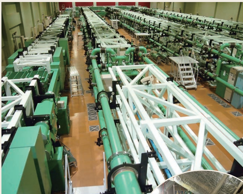
図1 高速点火方式のレーザーが並ぶフロア。右の3列(各列に4本のレーザーが配置されている)が燃料の圧縮を行う激光XII号、左の1列(4本のレーザーを配置)が点火を行うFIREX。

大阪大学レーザーエネルギー学研究中心では、ガラスレーザー「激光XII号(げっこうじゅうごう)」(30kJ、最大出力55TW)により慣性方式の核融合の研究を行っている。激光XII号で発振した12本のビームによる「中心点火方式」の実証のあと、現在あらたに加熱・圧縮用とは別に点火用レーザー「FIREX(フ