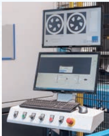
図3 部品の位置、向き、詳細を認識し、再現性の高い品質を保証するレーザービジョンシステム。

とで、このような疑問に答えられる。この作業には、一般的に高解像度カメラを使用し、レーザービームと同じ視線と光学系で見下ろすか、平行に見る必要がある(図4)。また、認識マーク(特定の形状の穴などの特徴)や、特定領域の材料の色のコントラストなど、部品上の基準位置を特定するには、画像処理ソフトウェアが必要である。この情報と事前にプログラムされた部品のCADデータを使用すると、加工前にレーザーシステムで部品やレーザーヘッドを適切に方向付けるためのオフセットを決定できる。例えば、レーザーガルボヘッド、ロボットシステム、直交軸シ