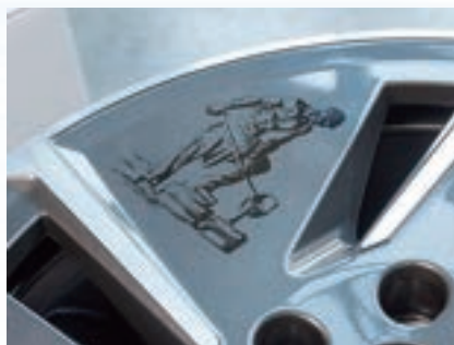
図1 複雑な表面に従来の小面積レーザー加工を行うと、完成品の表面に起伏ができる場合がある。

スレーザー、ファイバーレーザー、固体レーザーまで、さまざまな技術に及んでいる。それぞれに特徴があり、加工する部品によって選定される。これらの部品に対する主な加工方法は、レーザーマーキング、彫刻、構造化、切断、穴あけ、溶接、表面処理などである。性能、品質、スループット、コストの最適なバランスを持つレーザー光源を特定する