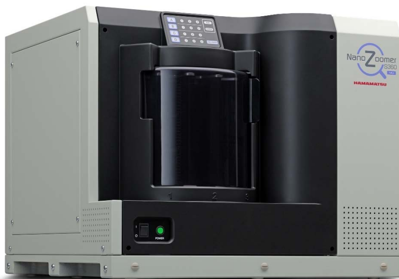
NanoZoomer® S360MD スライドスキャナシステム C13220-01MD