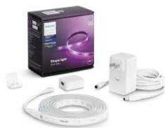
Hue ライトリボンプラス