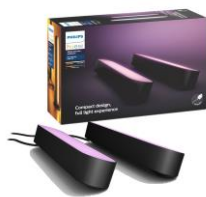
Hue Play ライトバー