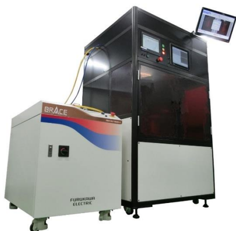
図 1. モータ用レーザー溶接機外観